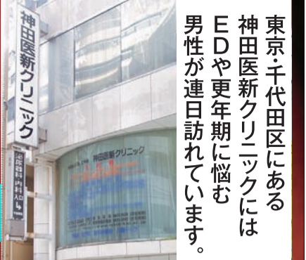
東京千代田区にある 神田医新クリニックには EDや更年期に悩む 男性が連日訪れています。