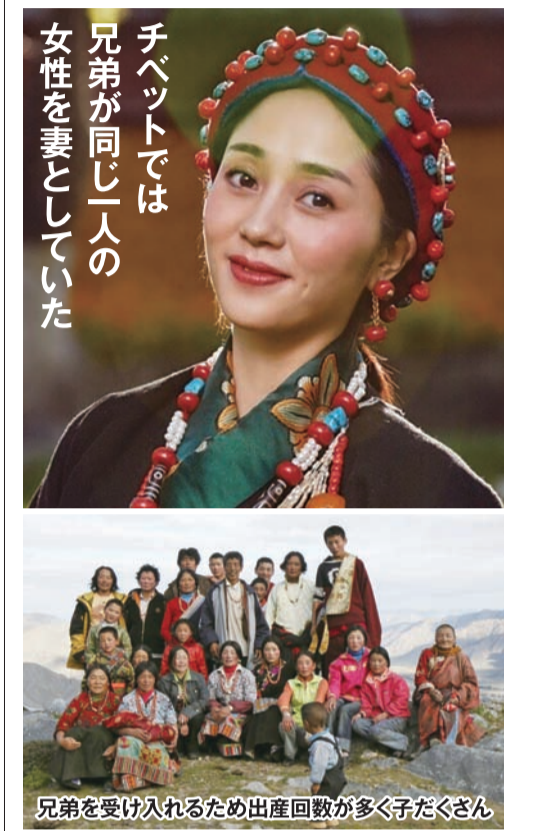
チベットでは兄弟が同じ一人の女性を妻としていた